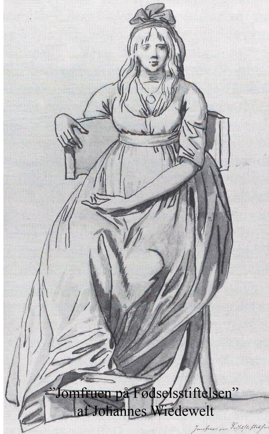
”Jomfruen på Fødselsstiftelsen” af Johannes Wiedewelt